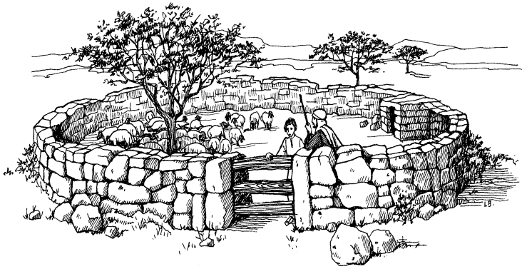
Sipisipi kame mende (Jone 10:1)

dupa pitaka laminao kalomba dokonya kamaka pyakalye-tala, baa wambao penge. Dopa pilyamopa, baanya sipisipi dupame baanya pii sepala, nyakamanya akali doko-lumu lao masetala, baa watao pengema. 5 Dopaka doko, sipisipi dupame endakali waka mendenya pii sepala, endakali doko nyakama nakandenge mende-lumu lao masetala, baa watao naenya paka pengemana” lea. 6 Jisasame kongali doko dokaita lamaiyaka doko, pii lamaiya dokonya tenge doko dokaitame aipa pyoo lelyape lao soo nanyiami.