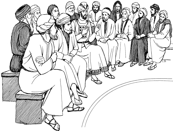
Juu dupanya kanjole dupa kambu pilyamino. (Jone 11:47)

55 Dokopa Juumanya Pasopa nee nenge gii doko tengesa piampopa, yuu yakane dupanya katao endakali longo kuni nasina lao pyoo wasalanya lalyoo Jerusalema peami. 56 Pupala dupame Jisasa kutiami. Kutapala lotuu anda nee nyetae kamapu dokonya katao nyakama-lapo laloo pyoo, "Nyakamame aipa lao masilyami? Baa nee andake dakenya nala naipapepe?" leami. 57 (Endakali mendeme Jisasa dosa kalyamo lao kande-kandeno doko, baa anjemana langina lao prisa mupapi, Parasipi dupame kyeto joo wamba lateami.)