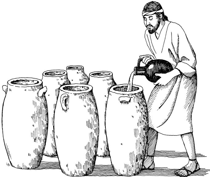
Penge kaname wasepae mendenya akali mendeme endaki kamuu pisilyamo. (Jones 2:6)

6 Endaki penge kaname wasepae tokange dosa sia. Penge dutupanya mendai-mendai lao endaki 100 litapi mende penenge. Penge dopale dupanya Juu dupame endaki kamuu pisetala, nyakamanya mana singili pyoo kaimala pyoo