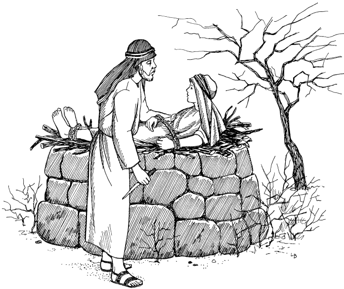
Abraameme Aisake pyao kundi maiyanya pilyamo. (Ibru 11:17-19)

pyatala katenge doko kumalanya pituu baa tata dupa lamai-yoo, “Israele dupa yuu dake yakinatala patami gii dokopa, nambanya kuli doko nyoo pupape” lao pii lanyaa setea.