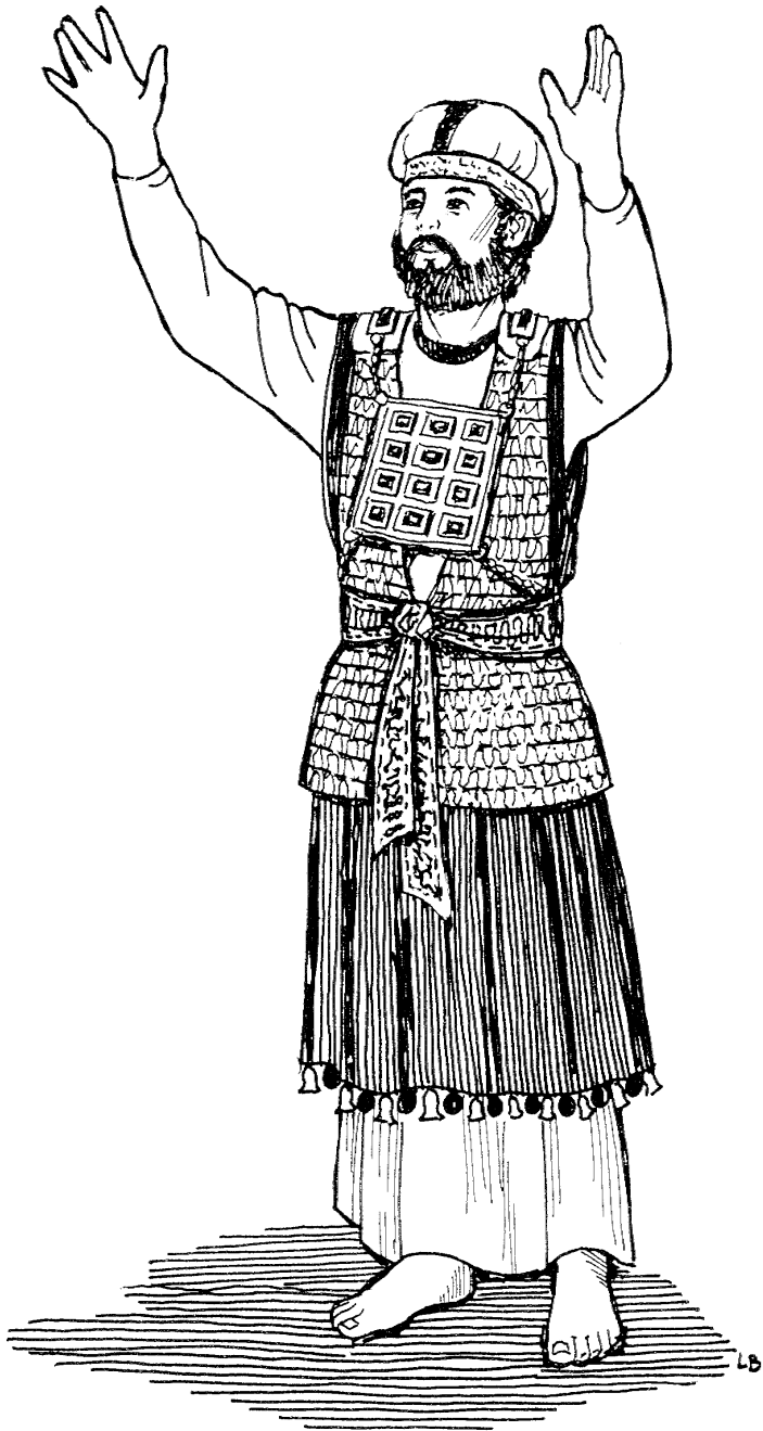
Prisa mupa mende kalyamo. (Ibru 5:1)